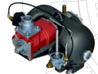
Pack Smart V75 XC - KPM14