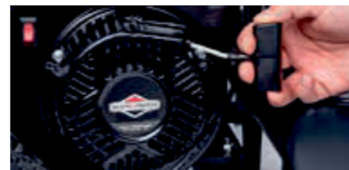
Avviamento a strappo