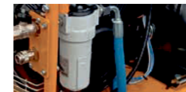
Separatore di condensa